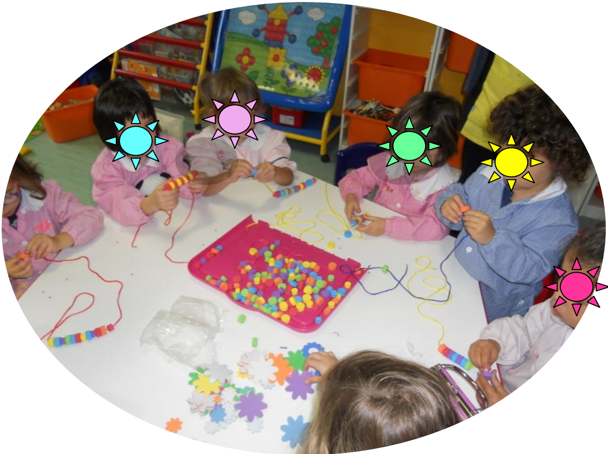
COSTRUIRE UN DONO PER GLI AMICI